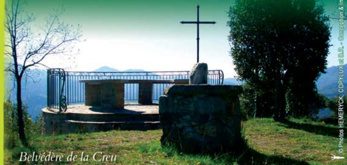
Belvédère de la Creu

Mairie de Montferrer Tél. 04 68 39 12 44 Fax. 04 68 39 89 60 www.tourisme-haut-vallespir.com