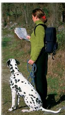
Départ du GR 10