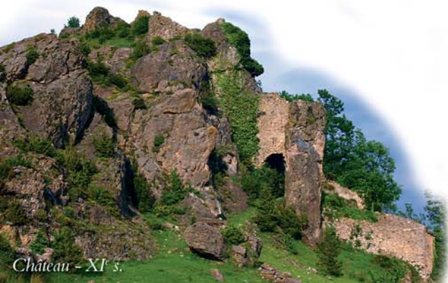
Château - XI e s.